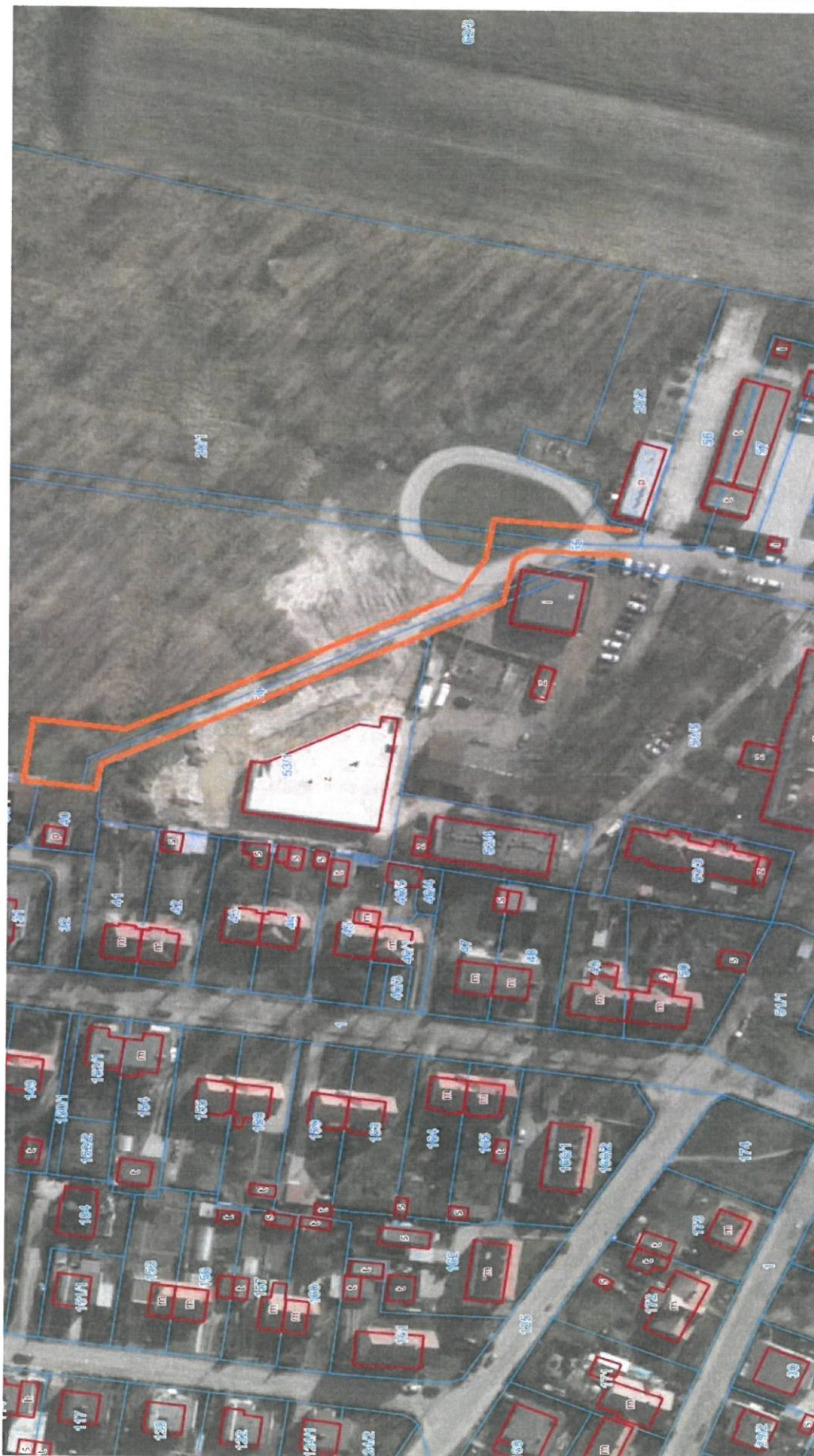
Rys. nr 2 – Fragment ortofotomapy terenu z zaznaczeniem lokalizacji obiektu